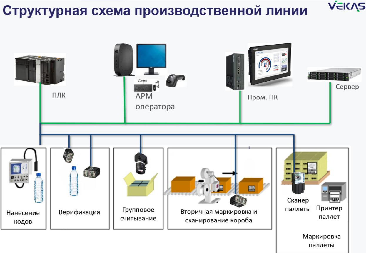
Рисунок 2. Типовая схема АСПУ для автоматической линии с двумя уровнями агрегации

Типовая схема работы АСПУ на автоматической линии приведена на рисунке 2: