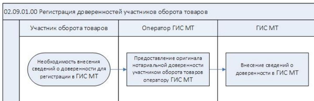
Рисунок 1 Схема процесса 02.09.01.00 Регистрация доверенностей участников оборота товаров

Схема процесса регистрации доверенностей участников оборота товаров в ГИС МТ представлены на [Рисунок 1 Схема процесса 02.09.01.00 Регистрация доверенностей участников оборота товаров].