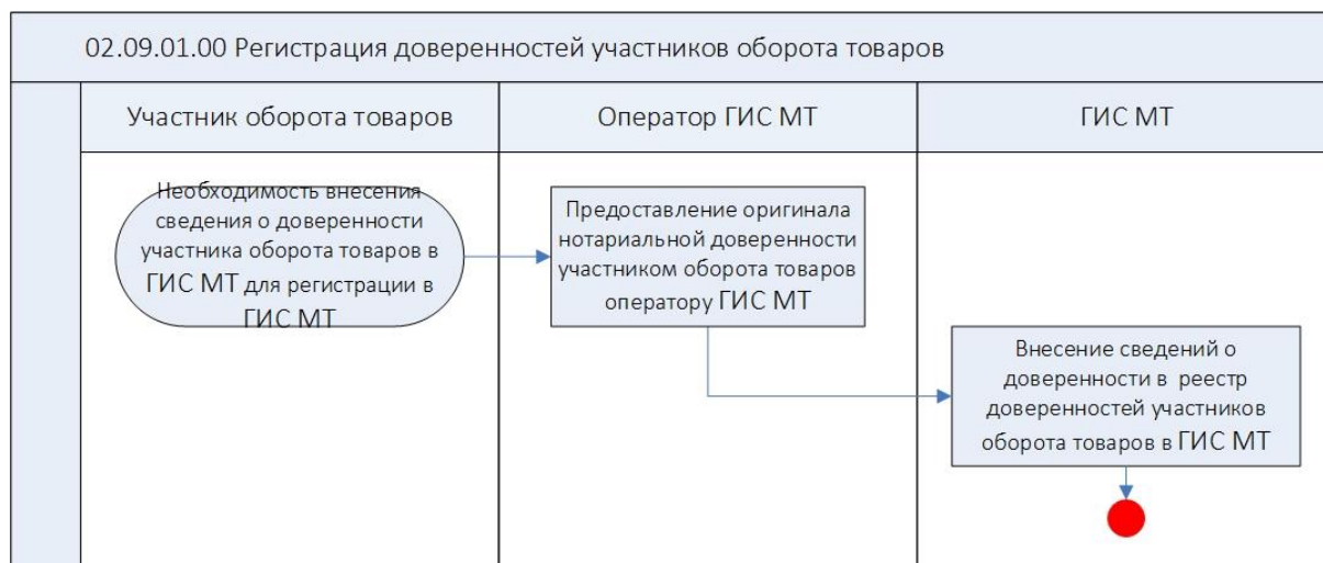
Рисунок 1 Схема процесса 02.09.01.00 Регистрация доверенностей участников оборота товаров

Схема процесса регистрации доверенностей участников оборота товаров в ГИС МТ представлены на [Рисунок 1 Схема процесса 02.09.01.00 Регистрация доверенностей участников оборота товаров].