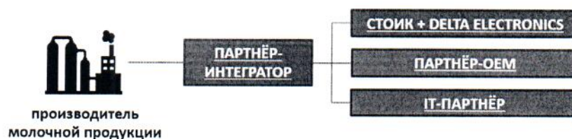
Основной вариант организации взаимодействия.

Благодаря вовлечению широкого круга региональных партнёров, координации их сотрудничества, а также поддержке на складах ООО «СТОИК ЛТД» необходимых комплектующих, удаётся оптимизировать стоимость и сроки реализации проектов.