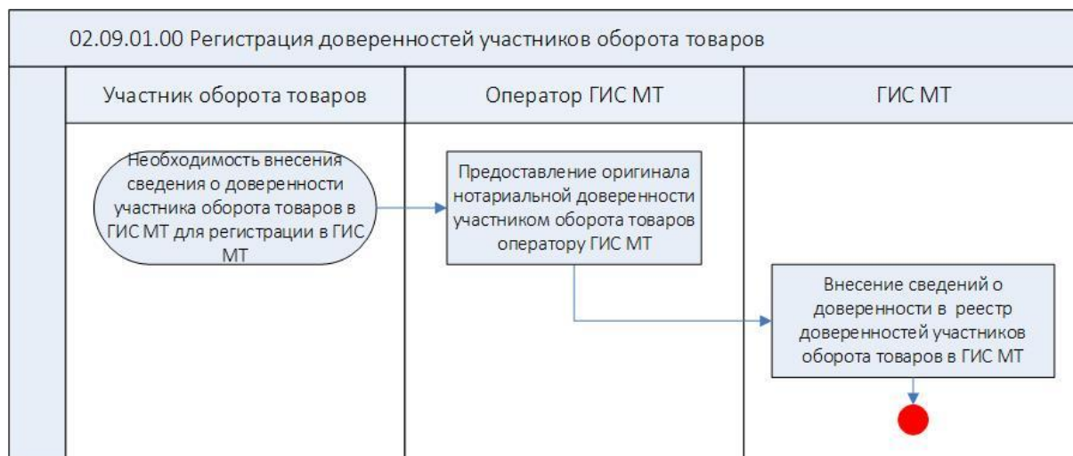
Рисунок 1 Схема процесса 02.09.01.00 Регистрация доверенностей участников оборота товаров

Схема процесса регистрации доверенностей участников оборота товаров в ГИС МТ представлены на [Рисунок 1 Схема процесса 02.09.01.00 Регистрация доверенностей участников оборота товаров].